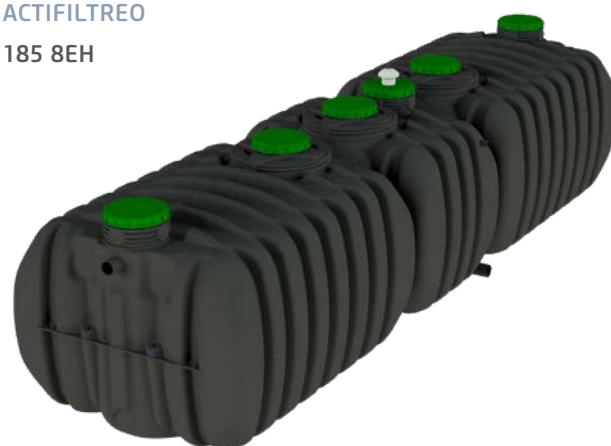
ACTIFILTREO 185 8EH